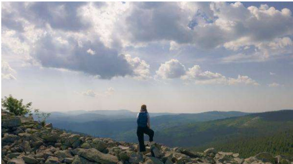
NaturVision – das bedeutet auch, in die Zukunft zu blicken