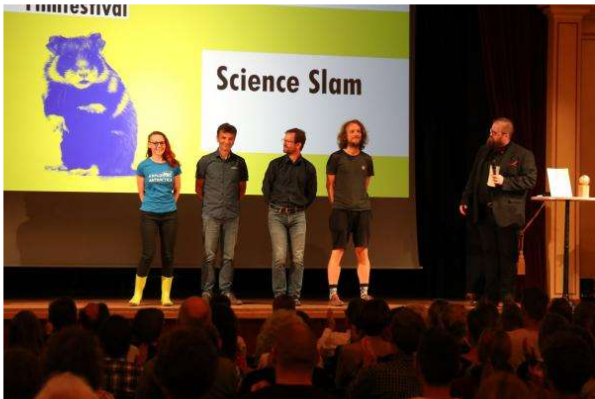
Auf jeden Fall besuchenswert: Unser Science Slam in der Musikhalle Ludwigsburg

mit etwas Glück ein Ticket gewinnen. Alle Infos zur Verlosung gibt es hier ... Für die ganz Spontanen gibt es auch eine Abendkasse.