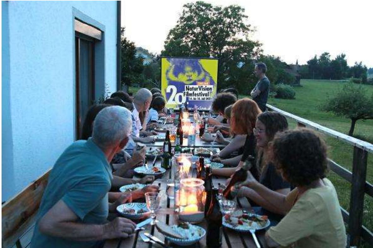
Kann man auch mit einem tollen Essen verbinden – Unser Jubiläumsfestival